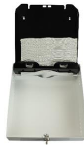
Code: 105 open